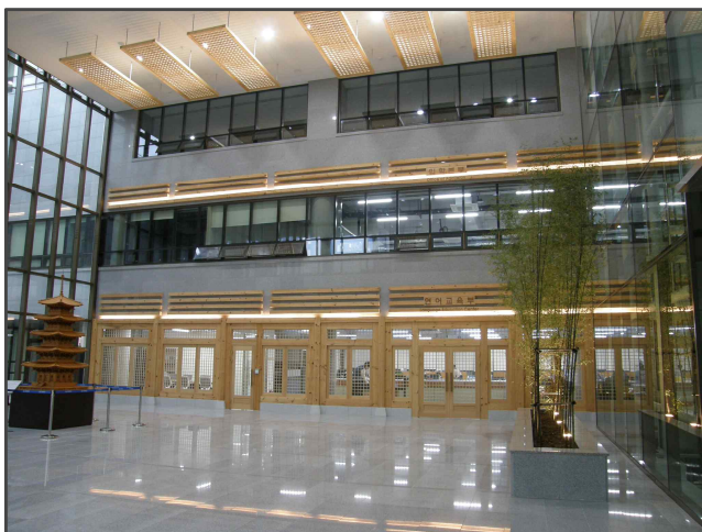
New Silk-Road Center

Korean Language Education Center(1st Floor) and Office of International Cooperation(3rd Floor)